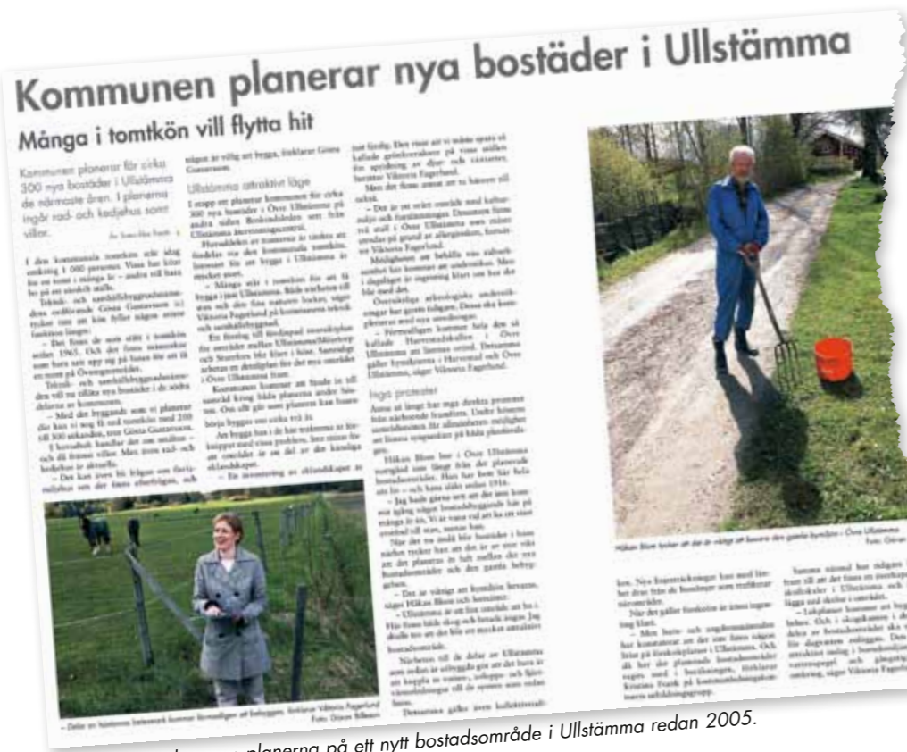
Dialog skrev om planerna på ett nytt bostadsområde i Ullstämman redan 2005.