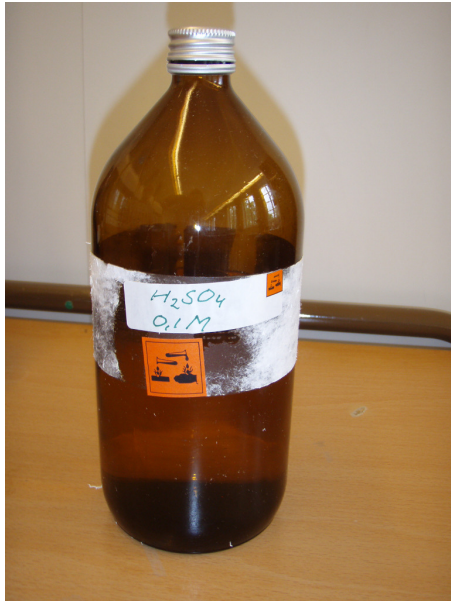
Egna beredningar ska märks med innehåll och farosymbol.

Märkning på skåp och/eller hyllplan underlättar god ordning. Olämplig samförvaring av kemiska produkter som kan reagera med varandra ska undvikas. Syror och baser bör inte förvaras inom samma invallning eller i samma skåp. Giftiga kemiska produkter ska förvaras i låst skåp. Utgallring av gamla kemiska produkter och produkter som inte längre används bör ske med ett intervall av 1-3 år. Utgallrade kemiska produkter är farligt avfall och ska lämnas för destruktion.