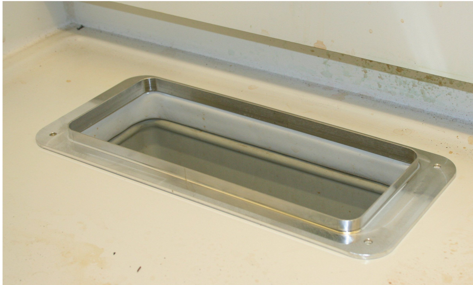
Kantlist runt utslagsvask i dragskåp för att undvika risk för läckage till spillvattennätet.