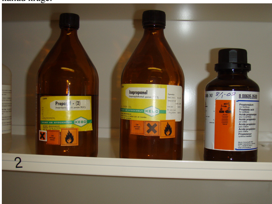
Förvaring av kemiska produkter bör ske inom invallning t ex i skåp med kanter på hyllplanen.

Förvaring av kemiska produkter i dragskåp med avlopp bör undvikas. Det gäller särskilt förvaring i öppna kärl. Åtgärder bör vidtas för att minska risken för spill till spillvattennätet. Beredning och förvaring i dragskåp kan ske på bricka, i plastback eller annan typ av invallning. Utslagsvasken kan också förses med propp, kantlist och täckskiva eller liknande. Övrig förvaring av kemiska produkter bör ske i utrymme som saknar golvbrunn och/eller inom invallning (t ex i plastback eller i skåp med kanter på hyllplanen). Om golvbrunn finns kan den förses med upphöjd kant, så kallad krage.