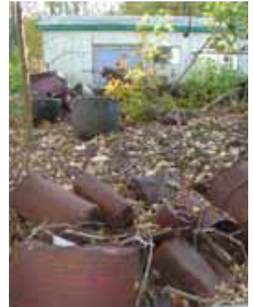
En bortglömd deponi?

För inspektörerna anordnades gemensamma riskklassningsmöten för att få en samordning och likartad bedömning i länet. Totalt arrangerades 6 riskklassningsmöten där 18 inspektörer deltog från 7 kommuner. Riskklassningsmötena hölls av personal från Länsstyrelsen som har erfarenhet av inventering enligt MIFO.