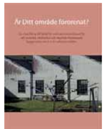
Broschyren - Är Ditt område förorenat?