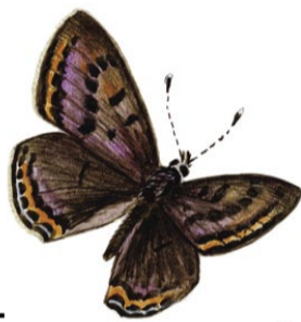
Violett-kantad guldvinge Lycaena hippothoe