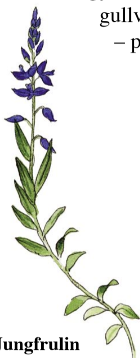
Jungfrulin Polygala vulgaris

I hagmarken lever växter som, tro det eller ej, gynnas av bete. Prästkrage, blåklocka, gullviva, kattfot, solvända, nattviol – på en enda kvadratmeter kan