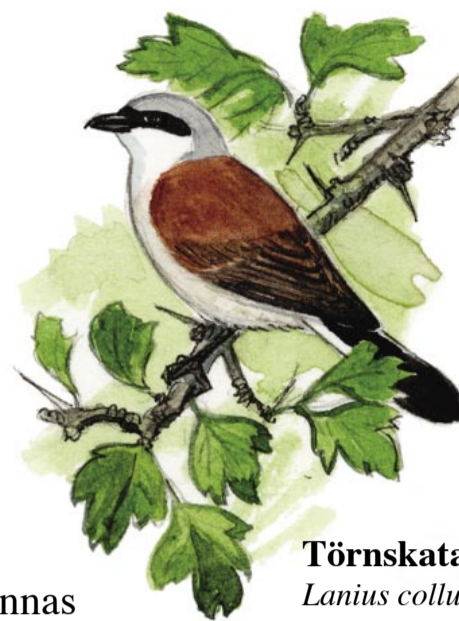
Törnskata Lanius collurio

Bilderna visar några av de arter som kan finnas i betesmarken.